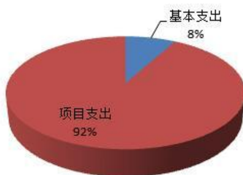
图 2：支出决算结构饼状图