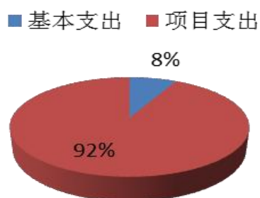
图2：支出决算结构饼形图

2017 年度本年支出 3271.86 万元，其中：基本支出 249.24 万元，占 7.62%；项目支出 3022.62 万元，占 92.38%。如图所示：