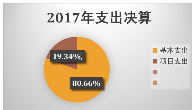
图 2：支出决算结构饼状图

本部门 2017 年度本年支出合计 724.23 万元，其中：基本支出 584.19 万元，占 80.66%；项目支出 140.04 万元，占 19.34%；